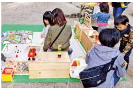
●おもちゃコーナー