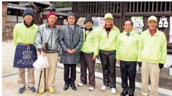
●太田市長と男性スタッフ