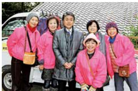
●太田市長と女性スタッフ