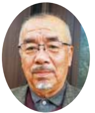
本地新田後援会長