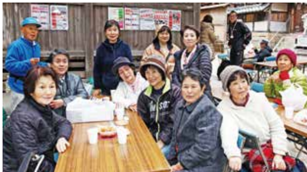
●太田市長と一緒に五平餅を