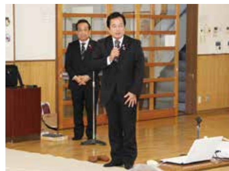
八木哲也衆議院議員