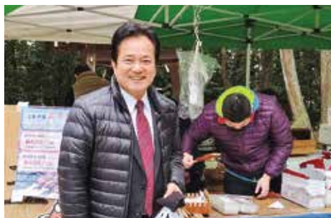
●神谷県議、五平餅購入ありがとうございました