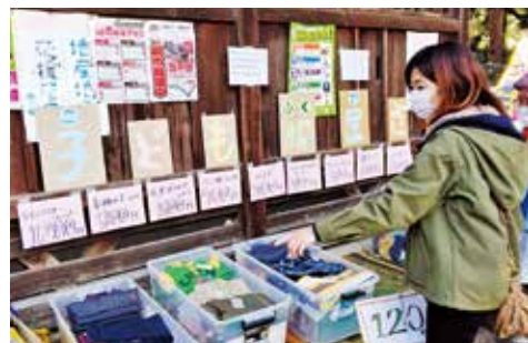
●子供服販売コーナー