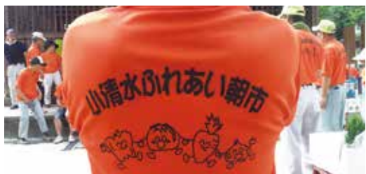
●出店者 スタッフのユニホームも一新!!