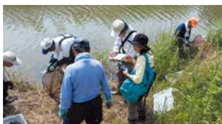
●逢妻女川のアカミミガメ捕獲活動 3日間で約380匹のアカミミガメが捕獲されました。(6月3日)