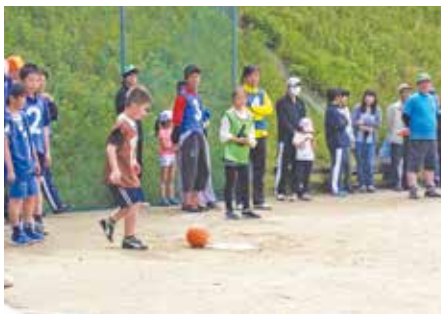
●宮口一色自治区主催 区民球技大会 キックベースボールの組対抗戦です。ボーイ スカウトの皆さんが審判で、大活躍でした。 (5月14日)