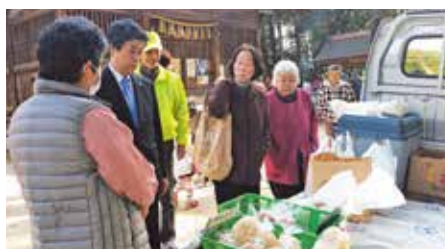
●太田稔彦豊田市長来場! 太田豊田市長が来場され、採りたて野菜を手にと懇談されました。(3月18日)