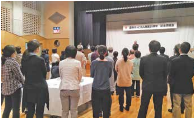
●豊田ほっとかん開業20周年記念懇親会 職員全員で設立当時の写真などを見て、20年の歩みを思い起こして みえました。これからの施設・事業の発展を誓いました。(6月5日)