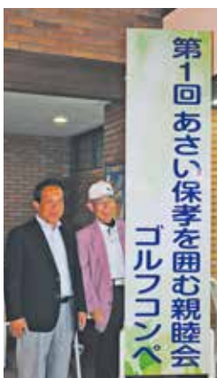
●ゴルフコンペの 看板が出来ました!