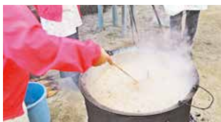
●今年最初の「小清水ふれあい朝市」 女性部による「七草がゆ=朝市がゆ」の振る舞いもあり、「朝市がゆ」を食べながらワイワイガヤガヤ!(1月21日)