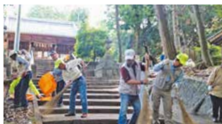
●宮口神社の定期清掃 小清水ふれあい朝市のスタッフ、朝市会場でお世話になっている宮口神社の定期清掃を行いました。(6月3日)