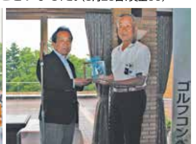
●優勝おめでとうございます!