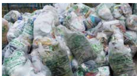
●ゴミステーション清掃ボランティア 毎月2回の町内のゴミステーション清掃ボランティアの日でした。(5月9日)