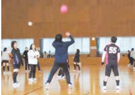
●逢妻スポーツクラブ主催ソフトバレー大会開催 参加13チームの熱戦が行われました。(1月28日)