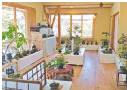
●山野草教室・風花 春の山野草展を鑑賞 会場は自宅の離れを利用して見事な山野草と 盆栽です。(5月27日)