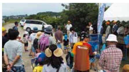
●逢妻交流館の環境講座「親子で逢妻女川探検隊・生き物を調査しよう!」 逢妻女川を考える会・豊田市矢作川研究所を講師に行われ親子20組が参加しました。(6月11日)