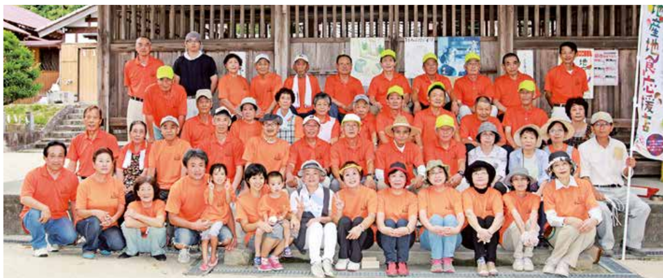
※小清水ふれあい朝市。出店者・スタッフで記念写真!