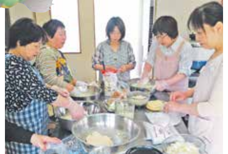
●本地新田女性会・ゴキブリ団子作り! 今回の教室は、「ゴキブリ団子」作りです。皆さ んの手際の良さに感心しました。(5月7日)