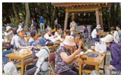
●手作りコロテンを販売!! 女性スタッフで手作りコロテンを販売しました。大人気でした。(8月5日)