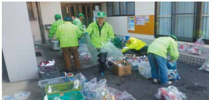
●宮口上自治区環境ボランティア 自治区内の約40ヶ所のゴミステーションのルール違反のゴミを回収します。今月も軽トラック5台分のゴミを回収し分別しました。(1月22日)