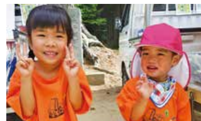
●ちびっこスタッフも「はい、ポーズ!」 ちびっこスタッフもユニホーム姿で。