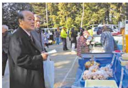
●八木哲也衆議院議員来場! 八木哲也衆議院議員におこしいたき、野菜作り話に盛り上がりました。(2月4日)