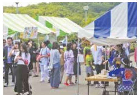
●地元の日本赤十字豊田看護大学大学祭 積極的に地域との関わりを持ってみえます。 当日は地域住民の来場者も多くありました。 (5月28日)