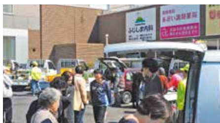
●ほっとかん祭りに出店 正面入口で軽トラックを並べ賑やかなほっとかん会場でした。(3月12日)