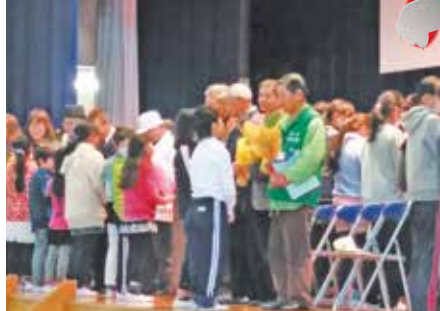
●小清水小学校 感謝の会に参加 地域の方に感謝する会です。あいづままる 隊も参加させていただきました。(3月2日)