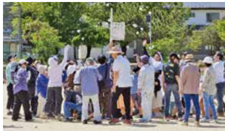
●本地新田自治区運動会