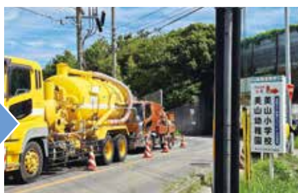
●バキュームによる緊急の土砂除去