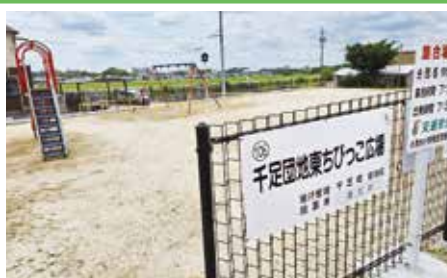
●ゆたか台公園地下の雨水貯蔵施設設置(令和4年) 逢妻女川に流れ込む水を減らすため貯蔵施設設置