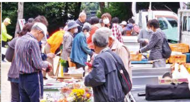
●小清水ふれあい朝市