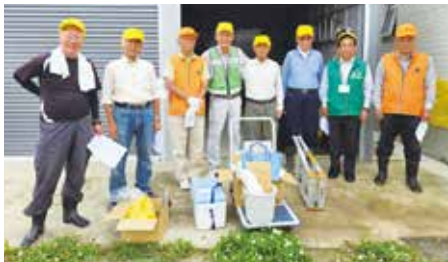
●千足地区環境保全活動