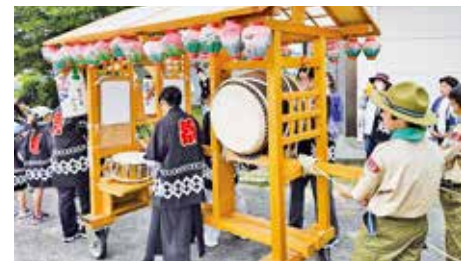
●宮口一色行者祭り