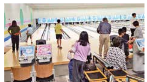
●広久手ボーリング大会