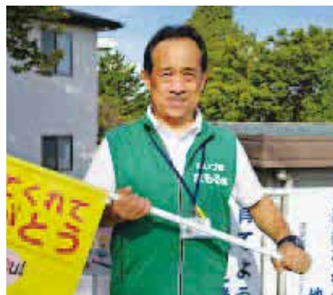
●毎朝の登校児童の見守り活動