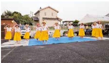
●フラダンス・銭太鼓