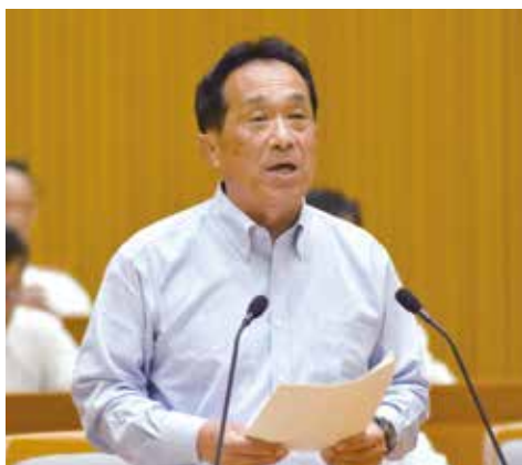
●議場にて、市や地域の課題を質問・提言