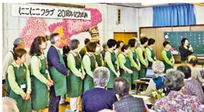
●深田山にこにこクラブ