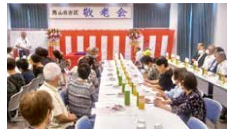
●西山自治区敬老会