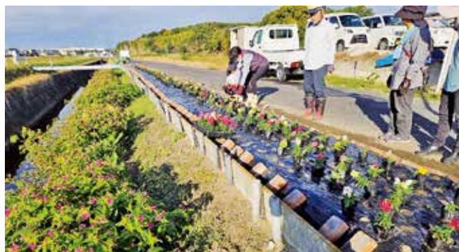
●向川サンボクラブ