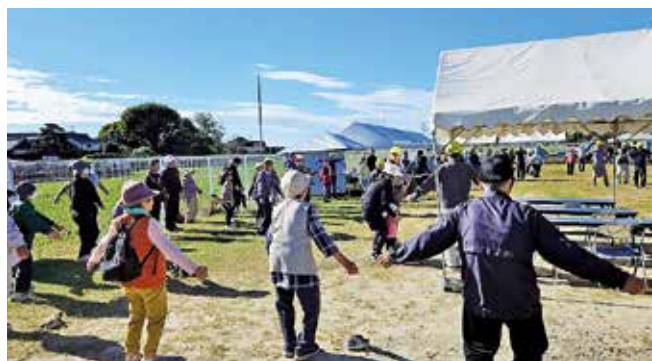
●コスモスクラブ千足