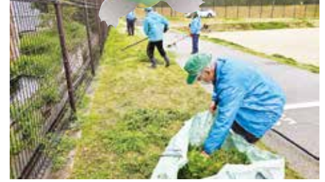
●深田山・柿本公園管理組合