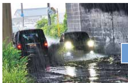
●令和5年6月2日豪雨による冠水