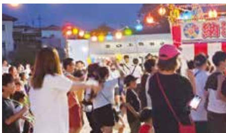
●宮口上自治区夏祭り