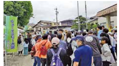
●宮口新田ウォークラリー