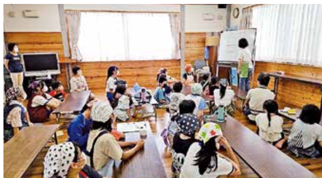
●逢妻子ども食堂きらりん