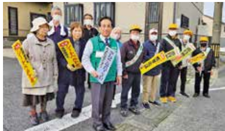
●交通安全週間・皆さんと立哨活動