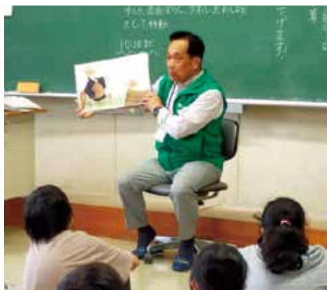
●小清水・美山小学校での読み聞かせ

今後、地域の皆様により身近な議員を目指し、市民目線に立った活動に努めてまいりますので、より一層のご指導、ご支援をお願い申し上げます。