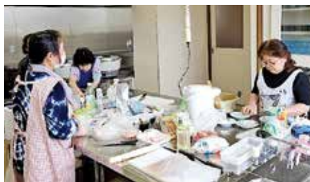
●本地女性会料理教室