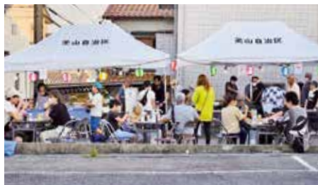
●美山自治区夏祭り