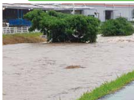
●8月31日豪雨・逢妻女川千足地区