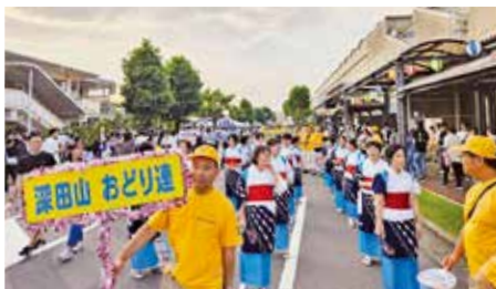
●深田山女性会踊り連、元町工場夏祭に参加