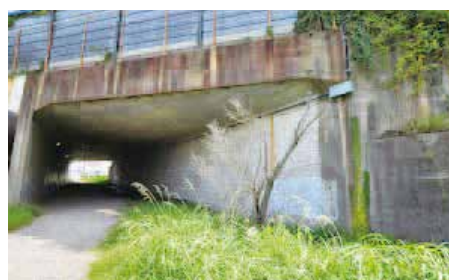
●今後、歩道設置も含めたガード下整備