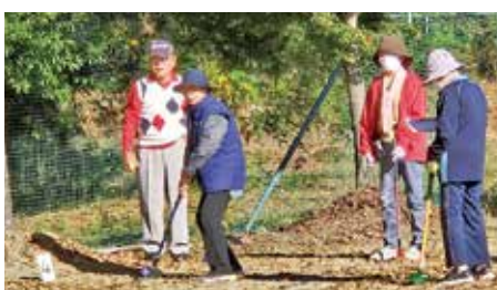
●グランドゴルフ大会