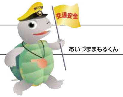
あいづまもるくん