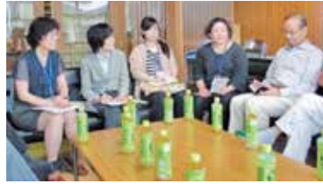
● 毎週火・水曜日の各自治区事務所訪問 区長さんより、区内の取組事項・市への要望事項の確認