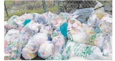
● ゴミステーションの清掃活動 ゴミステーションの清掃ボランティア活動(6:30～2回/月)