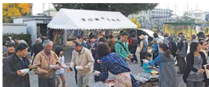
● 各自治区防災訓練 宮口上・宮口新田・宮口一色自治区主催の防災訓練が行われました。炊き出し、起震車体・煙・人工呼吸・119番通報体験など子供たちから高齢者まで多くの区民の皆さんが参加されました。(11月5・20・26日)