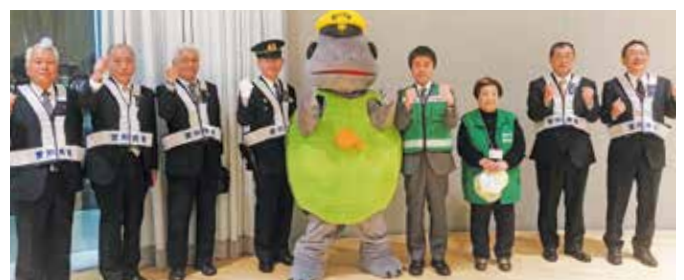
● 年末の安全なまちづくり運動 「あいづまもる隊」年末パトロール出発式が行われ、水野豊田警察署長・太田豊田市長・近藤豊田市市議会議長から励ましのお言葉をいただきました。(12月3日)