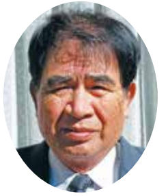
宮上地区後援会長