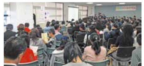
● 子どもシンポジウム2016 子どもたちの意見発表の機会として、豊田市のまちづくりに関する提案、意見交換を行いました。子どもたちの関心の高さや着眼点に勉強になりました。(12月11日)