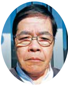
広久手町後援会長

こうした地道な活動に軸足を置き地域住民に、より信頼させる議員になっていただきたいと思っています。