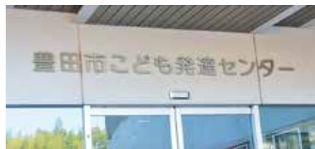
● 第21回豊田市子ども発達センター公開セミナー 今年のテーマは「子供とは・子供とどう関わるか」でした。子供たちが自立して生きていくためのサポートの大切さを再認識しました。(11月13日)