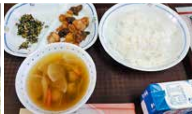
● 給食風景 逢妻中学校・小清水小学校の給食風景を視てきました。献立は、12月20日:のっぺ汁・ソフトカレーフライ・れんこんサラダ。1月10日:七草を使った「七草ごはん」でした。米・白菜・人参・大根・ネギ・七草など地元の野菜が食材として多く使われており、豊田市の地産地食推進の取組です。逢妻中学校では、グラスで残食0(125日目)や容器・ゴミの分別などにも取り組んでいました。(12月20日・1月10日)