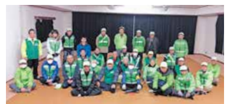
● 年末パトロール 宮口一色・広久手町自治区防犯会年末パトロールが行われました。それぞれの区域に別れてパトロールしました。もちろん、あいづまもる隊も一緒に参加しました!!(12月18・28日)