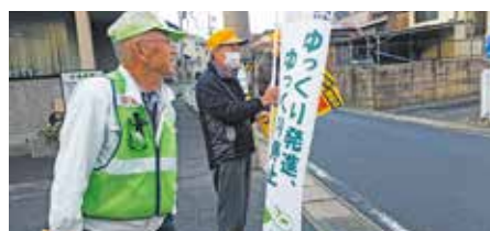
● 年末の愛知県交通安全県民運動 年末の愛知県交通安全県民運動が始まりました。早朝からの立哨活動ご苦労様です!!(12月1日)