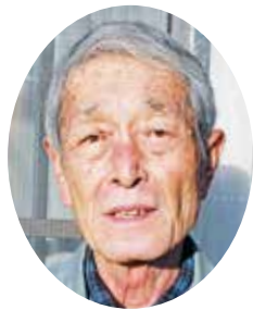
宮口新田後援会長