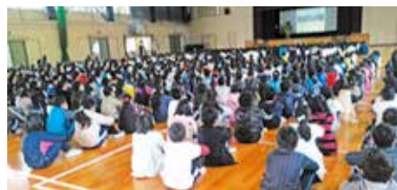
● 逢妻地域会議・あいづま交通マナー3週間チャレンジスタート式 小清水・美山小学校で行われました。平成23年から始まり自分の交通安全の目標を3週間守れたら「あいづまもる君クリアファイル」がもらえる取組です。(12月1日)