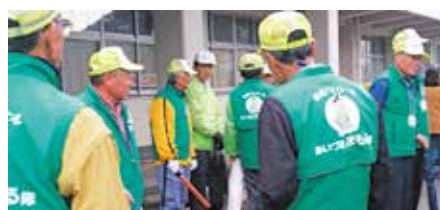
● 一緒に歩いて届ける一斉パトロール 小清水小学校区内の地域自主防犯会・あいづまもる隊の皆さん約40名で近所の子供たちと一緒に歩いて届ける一斉パトロールを行いました。(12月22日)